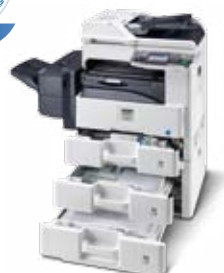
Abbildung mit Optionen.

KYOCERA MITA DEUTSCHLAND GmbH – Otto-Hahn-Str.12 – D-40670 Meerbusch Infoline: 08 00 8 67 78 76 – Fax: +49 (0) 21 59 9 18-106 – www.kyoceramita.de