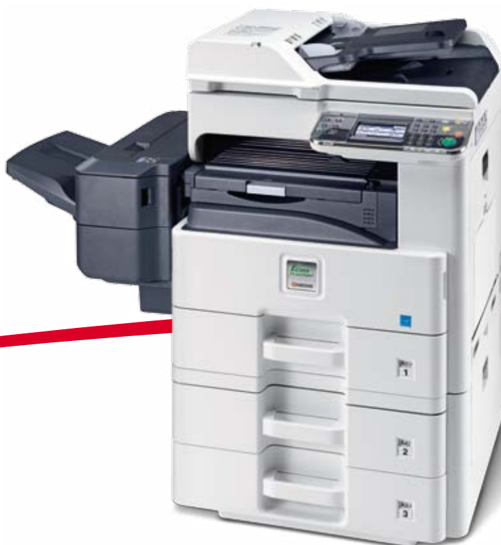
Abbildung mit Optionen.

25 JAHRE Wirtschaftlicher drucken und kopieren.